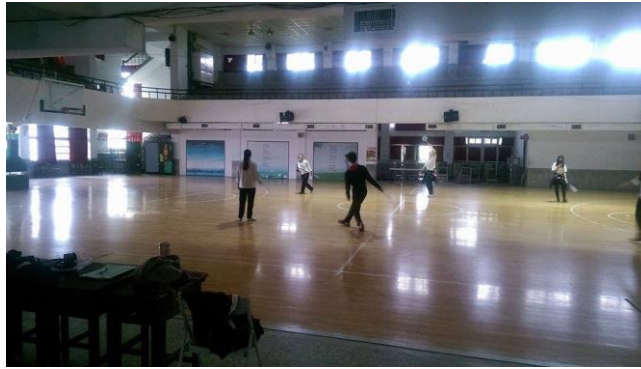
雲林國中一室內籃球場（1座）