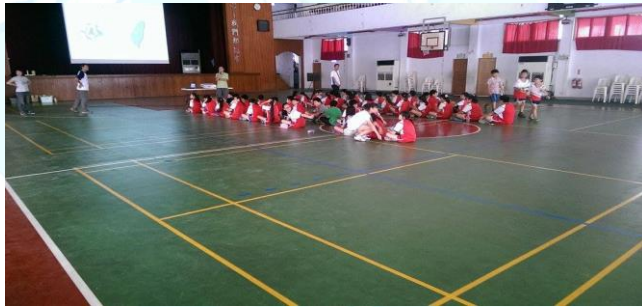
鎮南國小—室內籃球場（1座）