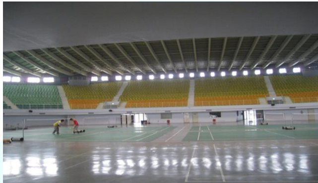
雲林縣立體育館一羽球場（6面）