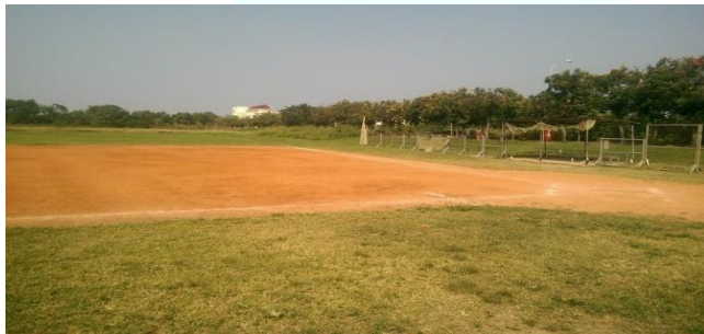
長安壘球場—室外壘球場（2座）